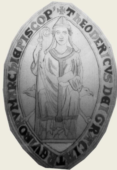
Theoderich II. von Wied (reg. 1212–1242)

Item quartam partem molendini in Wilinowe [...]